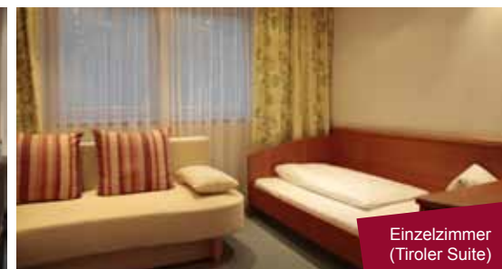
Einzelzimmer (Tiroler Suite)