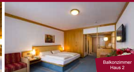
Balkonzimmer Haus 2