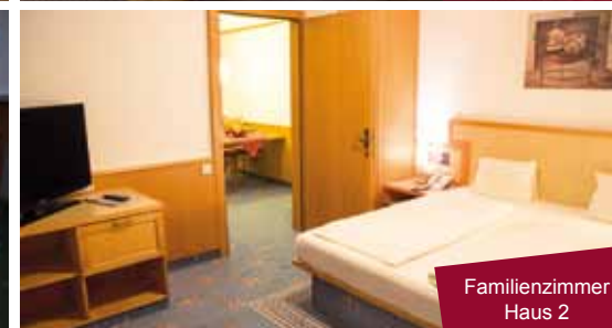
Familienzimmer Haus 2

Alle Bilder unserer Zimmer sind unverbindliche Beispiele. Abweichungen möglich. Spezielle Zimmerwünsche werden berücksichtigt, können aber nicht garantiert werden.